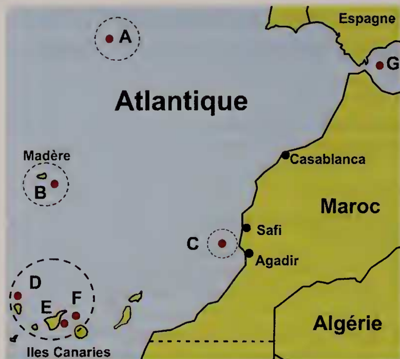
Figure 1 A-F. Aire de distribution atlantique ouest-africaine et sud-ouest européenne de Pseudosimnia juanjosensii (les cercles pointillés représentent des lieux de récoltes documentés): A. Josephine Seamount, B. Madère, C. Ouest Maroc, D-F. Iles Canaries. G. Mer d'Alboran.

collection du Musée Malacologique de Cupra Maritima (Italie), étiqueté Trapani (Fig. 2B)].